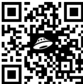
Рисунок 1 – Qr-code ссылка на нормативные документы по оформлению отчёта по практике

Отчёт должен быть оформлен в соответствии с общими требованиями, предъявляемыми к отчётным материалам (курсовым работам и т.п.). Все необходимые нормативные документы по оформлению отчёта по практике, а также образец заполненного отчёта и титульные листы представлены по ссылке на рисунке 1.